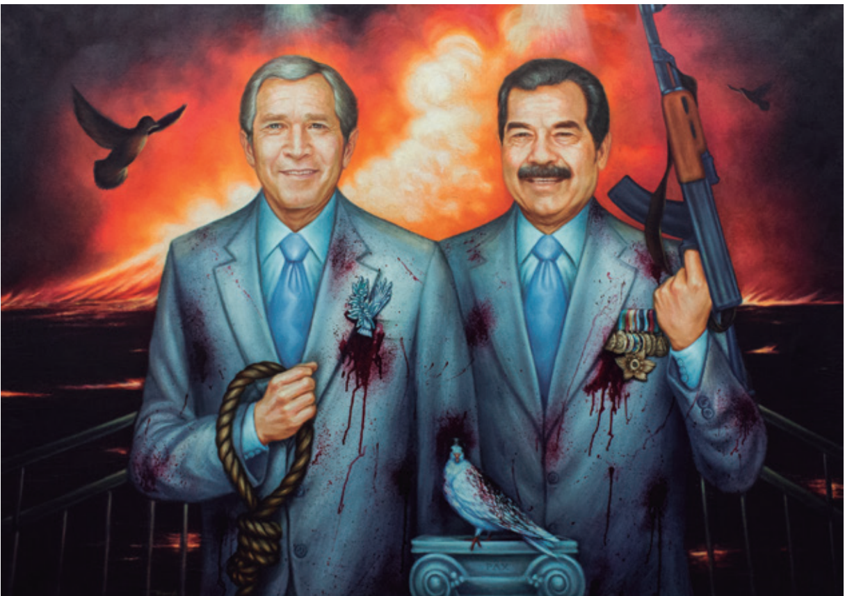
La paz sea / Óleo sobre lienzo / 105cm x 150cm / 2015